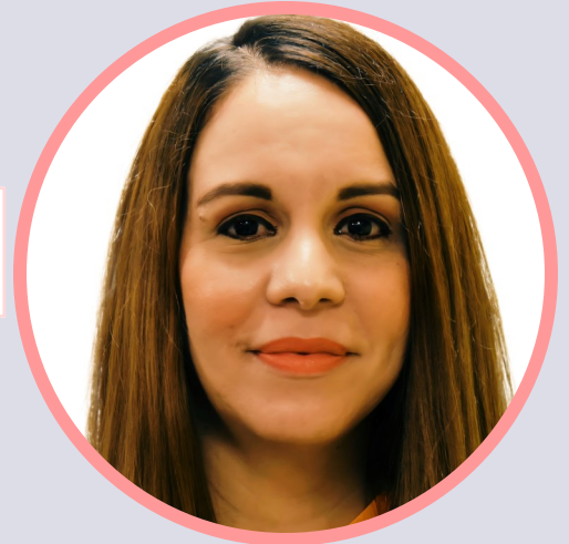
YEZLIN Especialista en Educación

“El servicio para nosotros significa entrega, pasión y el disfrute del deber”